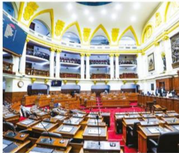
Este nuevo Parlamento no tendría mayoría como lo tuvo Fuerza Popular en el 2016.

Fuente: CPI, Perú Urbano Rural: Personas de 18 años o más de todos los HDI Nota: Total de personas encuestadas (1,600 entrevistados)